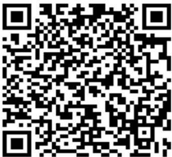
QR Code Generator Ver 2.4 (2020/11/06)

我的 IP 位址 | 最好的主機代管 - Linode VPS | Language: 繁體中文